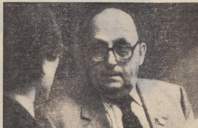
Для любого участника форума академик Г. А. Арбатов был интересным собеседником.