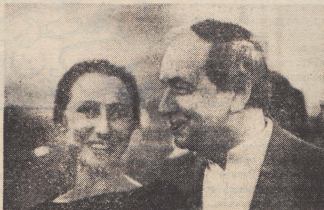
На этом снимке вы видите балерину Майю Плисецкую и поэта Андрея Вознесенского. На обороте снимка поэт написал: «Милым читателям «Пионерки» — сердечно».