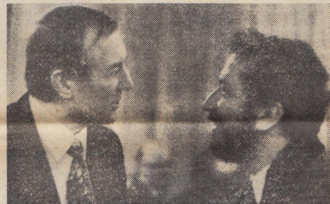
А поэт Евгений Евтушенко под своим снимком во время перерыва написал: «Мои читатели в «Пионерской правде», где в 1944 году были одобрены мои первые стихи».