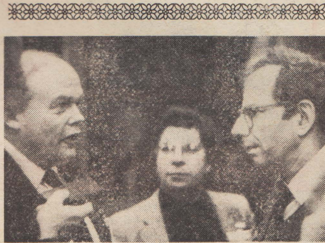
Даже в перерывах между заседаниями академика Е. П. Велихова невозможно было заставить одного. К нему один за другим подходили иностранные коллеги, журналисты.

Сегодня вы ещё учитесь. Учитесь понимать, жить, любить свою Родину. А любовь к Родине — это память о её прошлом, это понимание и бережное отношение к её культуре, это забота о её будущем.